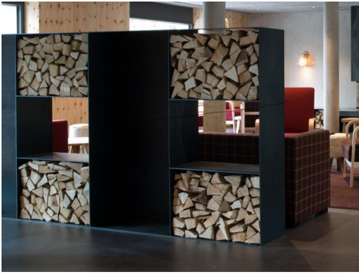
Holzgestell aus Schwarzblech