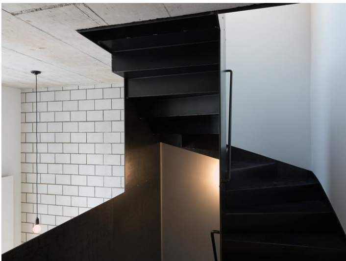
Treppe aus Schwarzblech

Fragen Sie Preise und Lösungsvorschläge für Arbeiten mit Schwarzblech einfach bei unseren Spezialisten an: