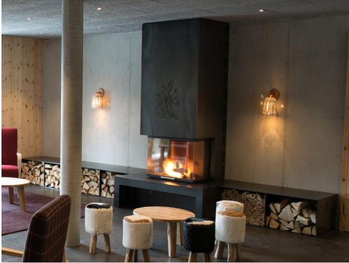
Ofenverkleidung aus Schwarzblech